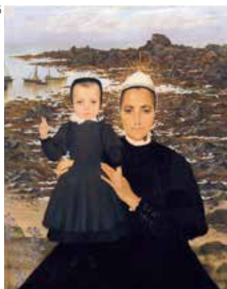
1.アルフレッド・ギユ《コンカルノーの歸加工場で働く娘たち》1896年頃 2.アルフレッド・ギユ《さらば!》1892年 3.ピエール・ボナール《アンドレ・ボナール嬢の肖像 画家の妹》1890年 愛媛県美術館蔵 4.フェルディナン・ロワイアン・デュ・ビュイゴドール《藁ぶき屋根の家のある風景》1921年 5.リュシアン・レヴィイ＝デュルメール《ハンマールの聖母》1896年