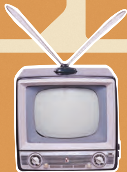
〈自黒テレビ〉 川崎市市民ミュージアム所蔵