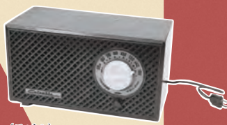
〈ラジオ〉 川崎市市民ミュージアム所蔵