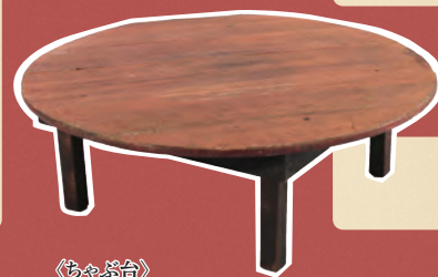
〈ちゃぶ台〉 川崎市市民ミュージアム所蔵