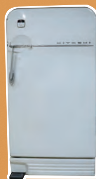
〈電気冷蔵庫〉 川崎市市民ミュージアム所蔵