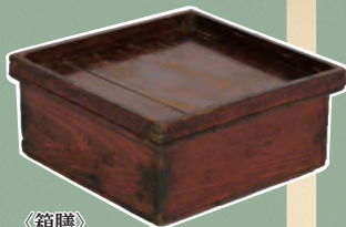
〈箱膳〉 川崎市市民ミュージアム所蔵