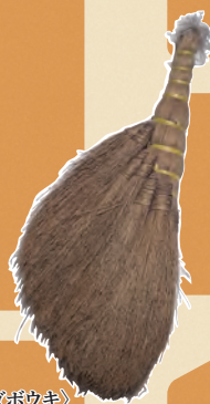
〈ミゴボウキ〉 川崎市大山街道ふるさと館所蔵