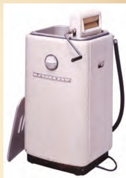
〈電気洗濯機〉 川崎市市民ミュージアム所蔵

戦後、1955年から73年の高度経済成長期に入ると、世の中はゆたかになりました。それは、技術が進歩し、家電製品が多くの家庭に普及することからも分かります。家電製品のおかげで短い時間で家事をこなすことができるようになり、人々のくらしは大きく変化しました。本展では、実際に使用されていた生活道具や当時の生活が分かる映像・写真を通して、川崎市が誕生した大正時代を軸に、その前後の時代のくらしの変化について紹介します。