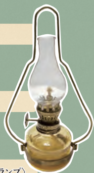
〈ランプ〉 川崎市大山街道ふるさと館所蔵