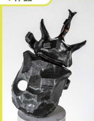
佐藤正和重孝《メガソマルスのトルソ》