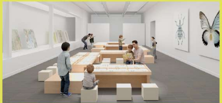
標本観察テーブル