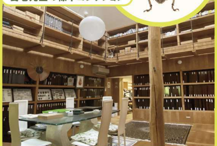
養老昆虫館・標本コレクションより