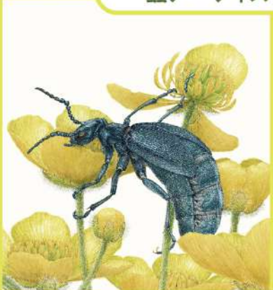
館野 鴻《つちはんみょう》