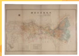
川崎都市計画図▶ (昭和12(1937)年)