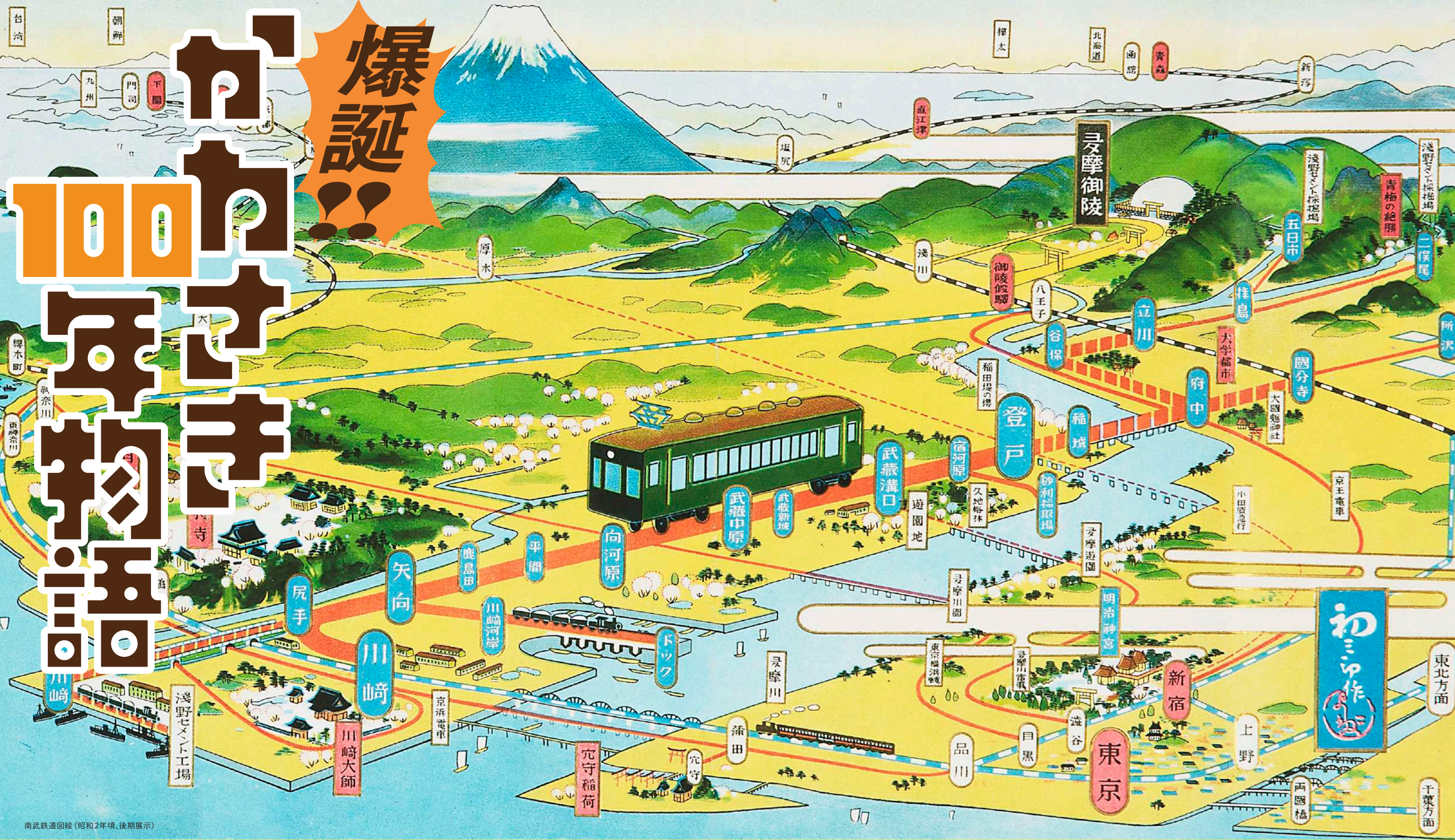
南武鉄道図絵(昭和2年頃、後期展示)

[前期] 2024 10/11 (金) ~ 12/13 (金) [開場時間] 9:00~17:00(最終入場は16:30) [観覧料] 無料