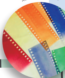
染色したフィルム

むかし しろくろえいが 昔の白黒映画やアニメーションを見たことがありますか？ かつて映像やアニメーションは映画フィルムでつくられ上映されて ていました。カラーフィルムが発明される前は白黒の映像が主流 でしたが、フィルムを染色することで豊かに色を表現した映画な どもあったのです。 このワークショップでは、フィルムを染色液に漬けて様々な色に 染めていきます。カラフルなフィルムに絵を描いて色あざやかな アニメーションをつくってみましょう！