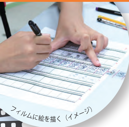
フィルムに絵を描く（イメージ）

むかし しろくろえいが 昔の白黒映画やアニメーションを見たことがありますか？ かつて映像やアニメーションは映画フィルムでつくられ上映されて ていました。カラーフィルムが発明される前は白黒の映像が主流 でしたが、フィルムを染色することで豊かに色を表現した映画な どもあったのです。 このワークショップでは、フィルムを染色液に漬けて様々な色に 染めていきます。カラフルなフィルムに絵を描いて色あざやかな アニメーションをつくってみましょう！