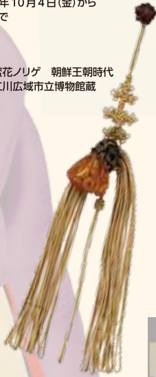
蜜花ノリゲ 朝鮮王朝時代 仁川広域市立博物館蔵