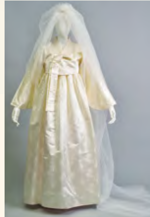
婚礼用純白チマ・チョゴリ 1965年 個人蔵