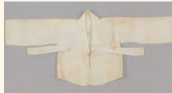
木綿のチョゴリ 1940年頃 在日韓人歴史資料館蔵