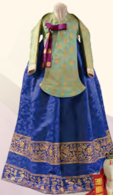
徳惠翁主着用タンイ・テランチマ 1922年頃、文化学園服飾博物館蔵 ※展示期間は2024年10月4日(金)から 10月27日(日)まで

2024年、横浜市と仁川広域市がパートナー都市提携を結んで15周年となります。これを記念し、横浜ユーラシア文化館では、朝鮮王朝時代の服飾品や現代の婚礼衣装などを通して、チマ・チョゴリの歴史や文化を紹介します。また、両市に暮らす国籍や民族を超えた多彩な人びとの思い出のチマ・チョゴリを、その衣装に込められたストーリーとともに紹介していきます。