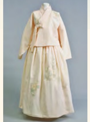
長襦袢生地の寿衣 2017年 康静春氏製作所蔵