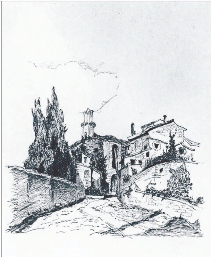
岩田榮吉 【坂道】 鉛筆・ペン 制作年不明 125×135mm

今回の展示では、学生時代の作品8点にみる風景の扱い方・描き方と、その後渡仏後30歳台前半に集中的に取り組んだ風景スケッチと油彩作品計27点、その他作品4点に写真資料を加え、岩田の画業全体に「風景画」がどのような意味を持っていたのかを探ります。