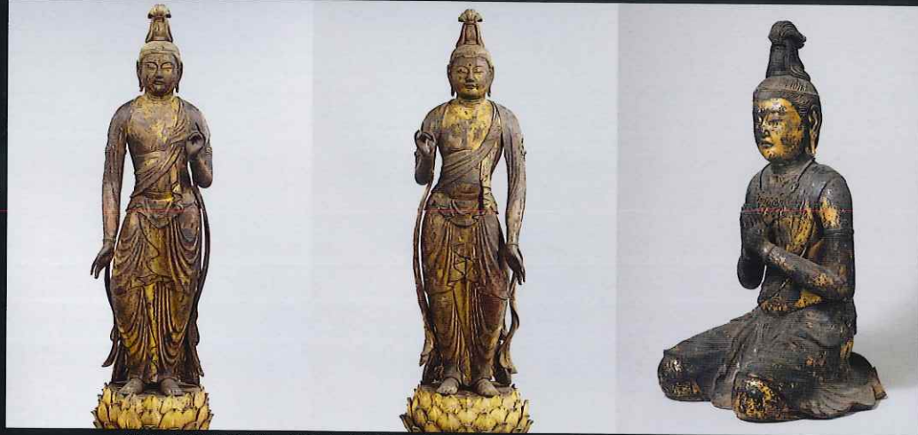
観音・勢至菩薩立像 清水寺(京都) 重要文化財 京都における鎌倉時代初期の運慶工房作とみられる