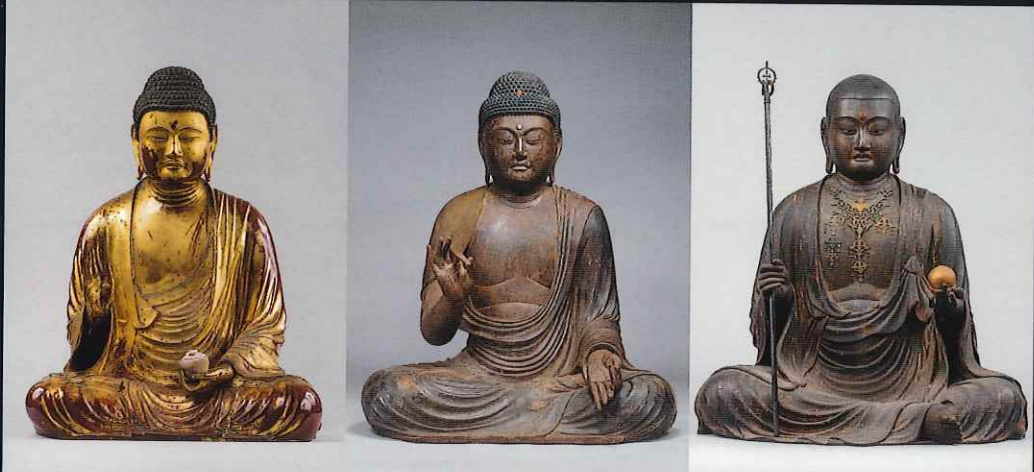
薬師如来坐像 寿福寺(神奈川) 重要文化財 北条政子発願で原型は運慶工房作とみられる