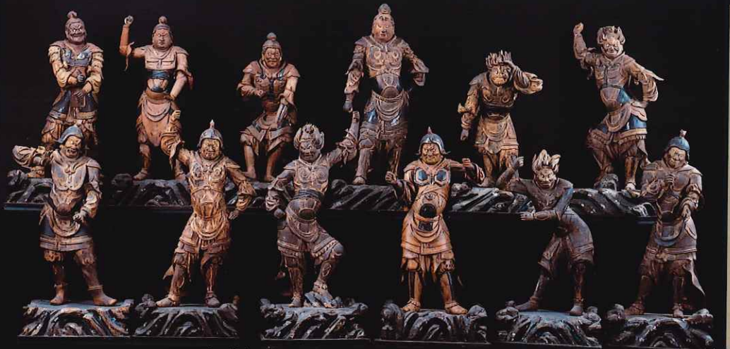
十二神将立像 曹源寺(神奈川) 重要文化財 運慶工房作の十二神将立像を一挙公開