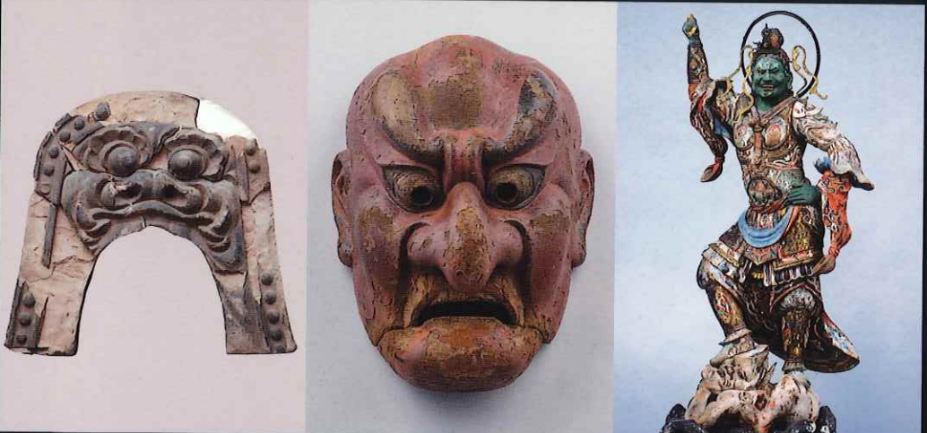
鬼瓦 鎌倉市教育委員会 鎌倉永福寺出土で原型は運慶工房作とみられる