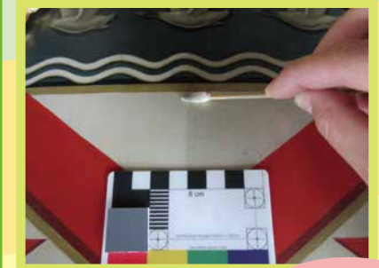
絵のクリーニング