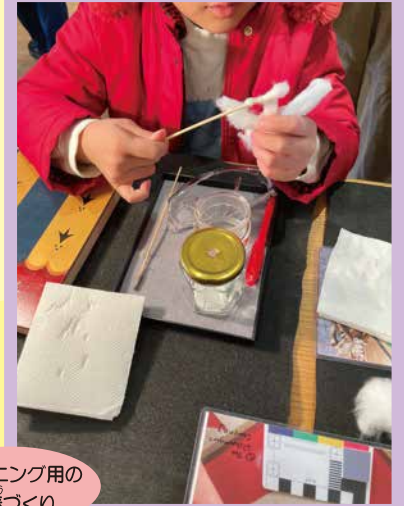
クリーニング用の綿棒づくり