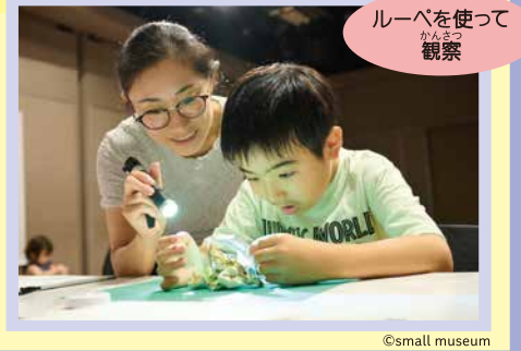
ルーペを使って観察

会場には昔の服やお菓子を作る道具、ちょっと古くて不思議な形の物を展示したコーナーがあるよ。展示してあるものを特殊な光が出る道具や手袋を使って観察。拡大したり、光を当てるとどんな風に見えるかな？続けて、修復にチャレンジ。壊れたり汚れたりした物ってどうやって直すの？コンサバターと一緒に体験してみよう。見ることに加えて自分の手でさわって感じることも大切にしたい、観察・発見の楽しさをみんなで体験するワークショップです。