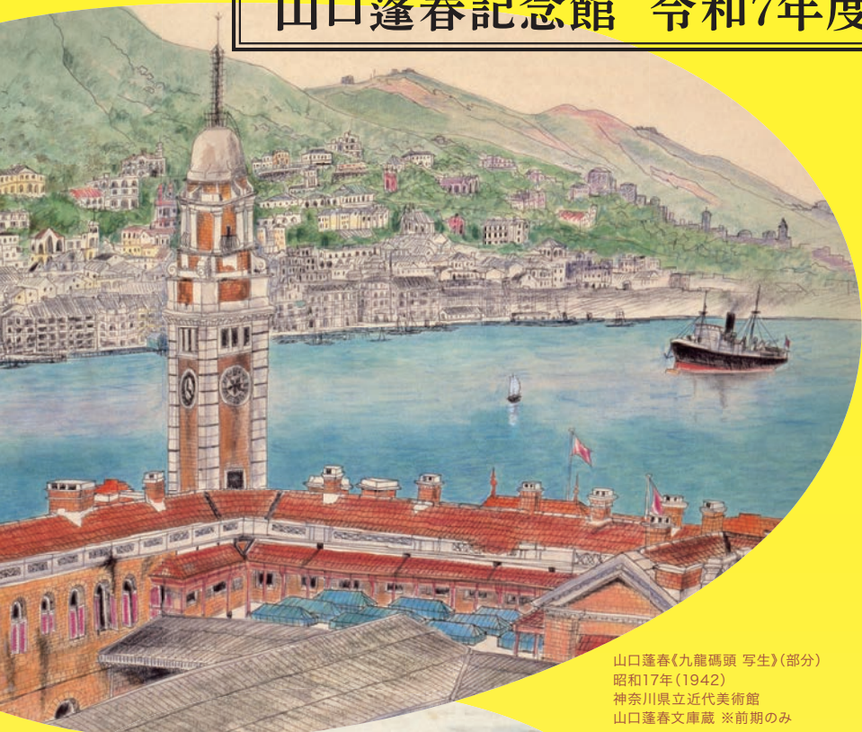
山口蓬春《九龍碼頭 写生》(部分) 昭和17年(1942) 神奈川県立近代美術館 山口蓬春文庫蔵 ※前期のみ

山口蓬春《波野 下図》(部分) 昭和6年(1931) 神奈川県立近代美術館 山口蓬春文庫蔵